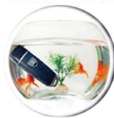
ทนทาน กันน้ำได้