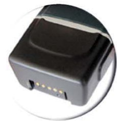
เชื่อมต่อได้ทันที ไม่ว่าจะตั้งข้อมูล หรือชำระผลส่งงาน